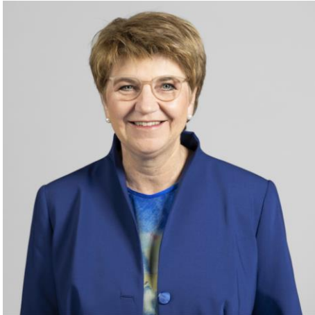
Viola Amherd Bundespräsidentin

Verteidigung, Bevölkerungsschutz und Sport VBS: