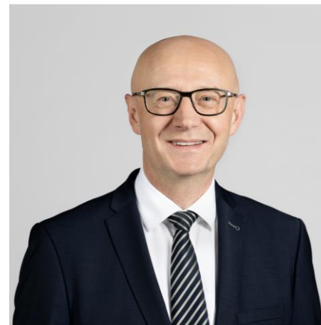
Viktor Rossi Bundeskanzler