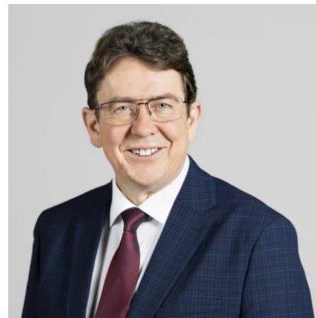
Albert Rösti Bundesrat

Umwelt, Verkehr, Energie und Kommunikation UVEK: