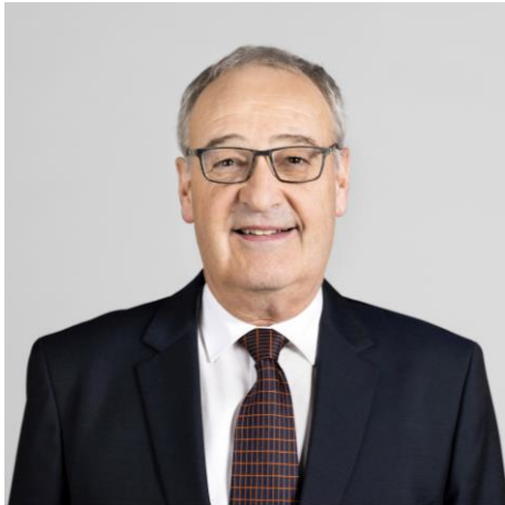
Guy Parmelin Bundesrat