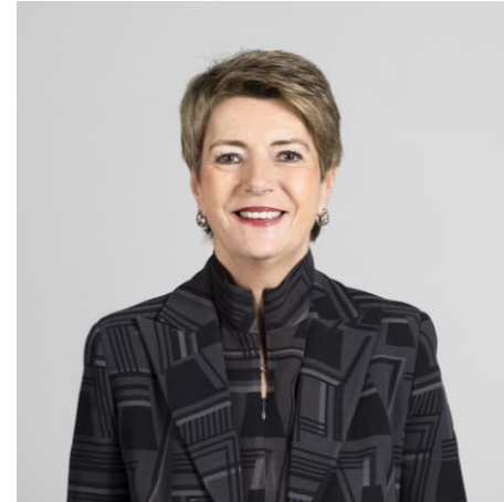
Karin Keller-Sutter Vizepräsidentin