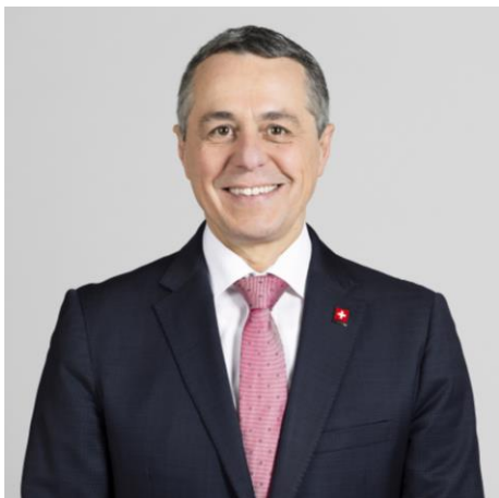
Ignazio Cassis Bundesrat