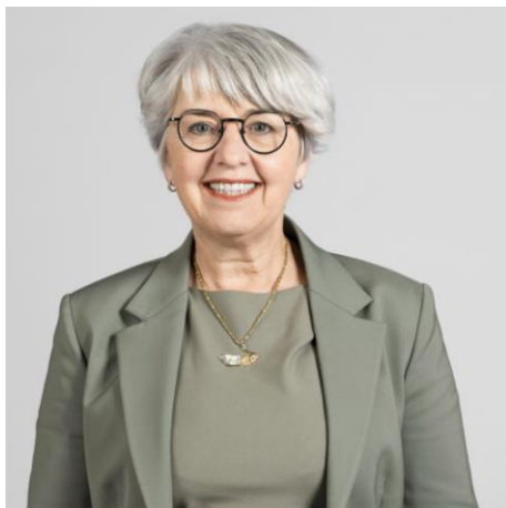
Elisabeth Baume-Schneider Bundesrätin